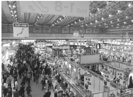
スーパーマーケット・トレードショーの様子

全国商工会連合会では、日本各地のすぐれた商品を開発・販路開拓を支援する全国展開支援事業「ニッポンいいもの再発見!」の一環として、「バイヤーズ・セレクトション」を実施しております。