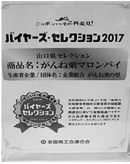
バイヤーズ・セレクション認定証

今年度のバイヤーズ・セレクション部門では全国で7商品が選出され、本県からは、企業組合がんね栗の里(やましろ商工会)の「がんね栗マロンパイ」が選出されました。審査員からは、「地域性、ストーリー性にも富み、バイヤーが取扱いたい逸品」などの高い評価を得られました。なお、企業組合がんね栗の里は、昨年も同セレクション選出(商品名:がんね栗衛門)され、連続選出となりました。